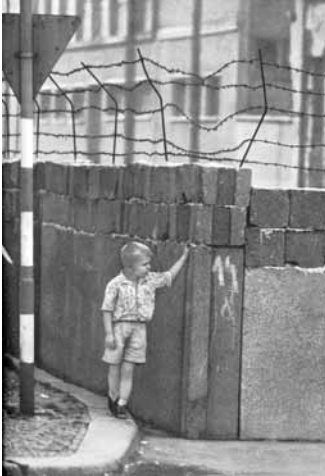
Wolfdietrich Schnurre: Eine Stadt wird geteilt, Berlin 1962, S. 58

Selbst nach Fertigstellung wirkt die Mauer der „ersten Generation“ im Frühjahr 1962 wie ein Provisorium und keineswegs unüberwindbar.