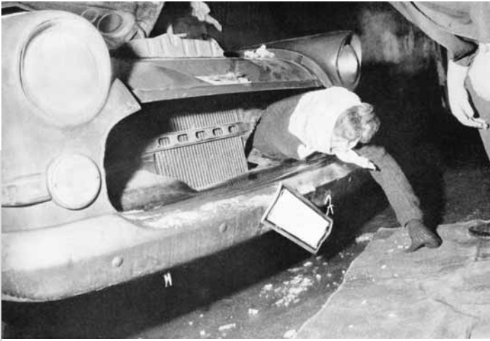
Fluchtversteck im speziell präparierten Motorraum eines PKW

Es geschah an der Mauer, Katalog zur Ausstellung der Arbeitsgemeinschaft 13. August, Berlin 1992, S. 60