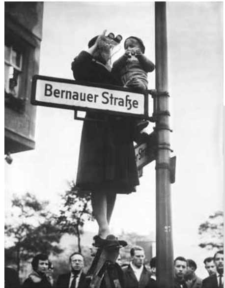
13. August 1961. Info-Kassette des Berliner Senats für die Erwachsenenbildung, Berlin 1962

Je höher die Mauer wächst, desto größer werden die Anstrengungen der Menschen im Westen, wenigstens Sichtkontakt mit ihren Freunden und Verwandten im Osten zu halten.