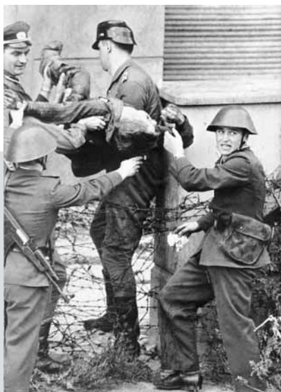
17. Juli 1962: Bei einem Fluchtversuch wird der 17-jährige Arbeiter Peter Fechter angeschossen und verblutet qualvoll an der Mauer. Volksarmisten tragen seine Leiche fort.

Es geschah an der Mauer, Katalog zur Ausstellung der Arbeitsgemeinschaft 13. August, Berlin 1992, S. 54