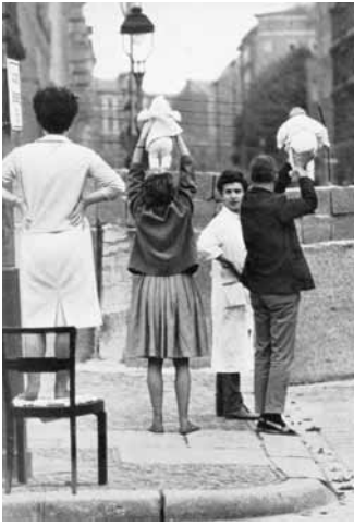
Wolfdietrich Schnurre: Die Mauer des 13. August, Berlin 1962, S. 56

Kommentar von Wolfdietrich Schnurre: „Um vor einem Überfall der Bundesrepublik sicher zu sein, sagt Ulbricht, habe er die Steine geschichtet. Hier blickt die erfolgreich abgewehrte Streitmacht nun also über die Mauer.“