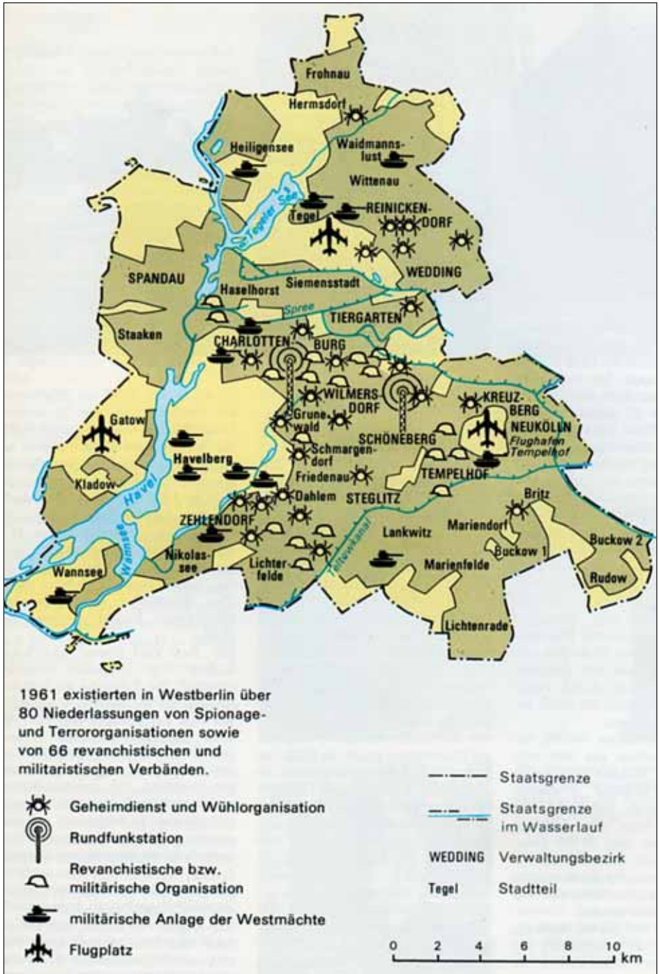
Aus einer DDR-Propagandabroschüre: Ein Spinnennetz von „Agentenzentralen“ in West-Berlin

illustrierte historische hefte 19. 13. August, Berlin (Ost) 1979