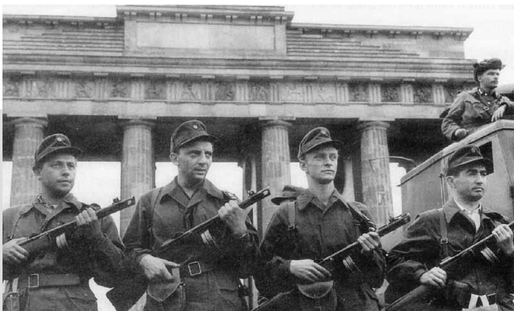
Volker Koop: Armee oder Freizeitclub? Die Kampfgruppen der Arbeiterklasse in der DDR / Volker Koop, Bonn 1997, S. 351.

Original-Bildunterschrift Ost: „Die Kämpfer aus unseren VEB und staatlichen Institutionen auf der westlichen Seite des Brandenburger Tores schützen unsere Grenzen. Die Beschlüsse von Partei und Regierung werden konsequent durchgeführt. Alle Kraft in den Dienst des Friedens.“ Das Bild wurde später gesperrt, da alle abgebildeten „Kämpfer“ in den Westen flüchteten.